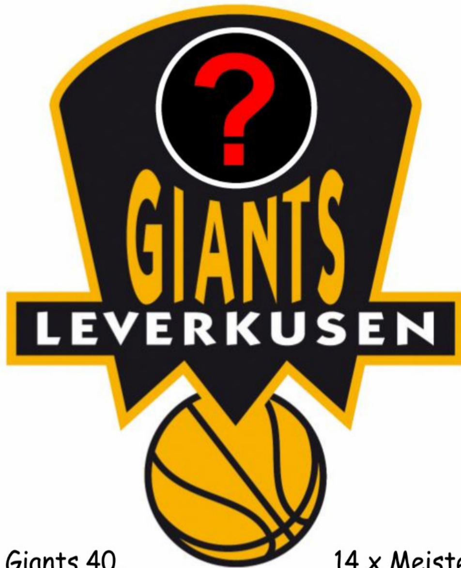
Giants, 40, Rekordmeister